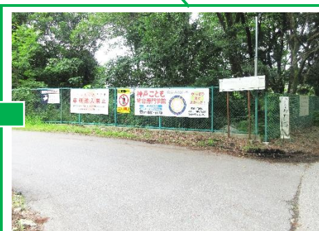
「神戸子ども専門総合学院」看板の 道を左へ（※この辺りに職員が待機 しています）