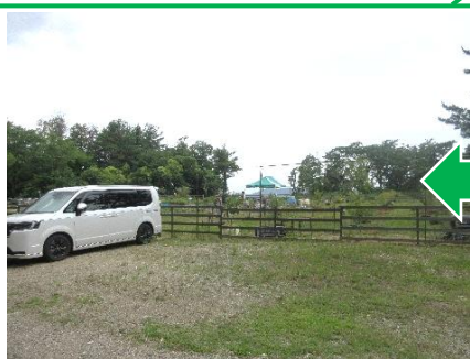
アリスガーデンテラス到着