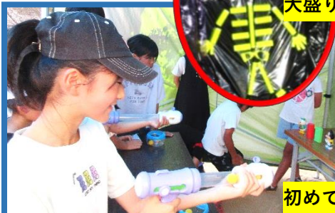
初めての射的&金魚屋さん