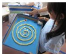
ビー玉ぐるぐる（お楽しみ会）