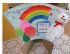
のびのびカレンダー

新一年生は 4 月 13 日(月)～24 日(金)までの のびのび開設時間内 ※火・土・日・祝日は開設していません。