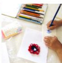
ミャクミャク工作