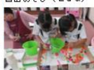
おはしてつかむゲーム