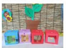
夏休み工作（ちよんぱこ）