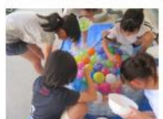
ヨーヨー釣り（交流）