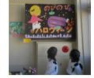
壁面作成（通年・毎月）

○スポーツ安全保険に加入される方は、スポーツ安全保険の保険料（年額 800 円）を添えて、お申し込みください。（学童保育と併用で利用する場合は加入は不要です。）