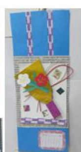
のびのびカレンダー