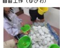
たからさがしゲーム（クリスマス会）