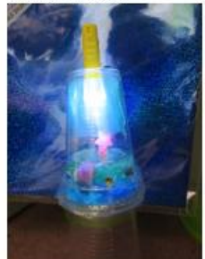
夏休み工作（シーラタン）